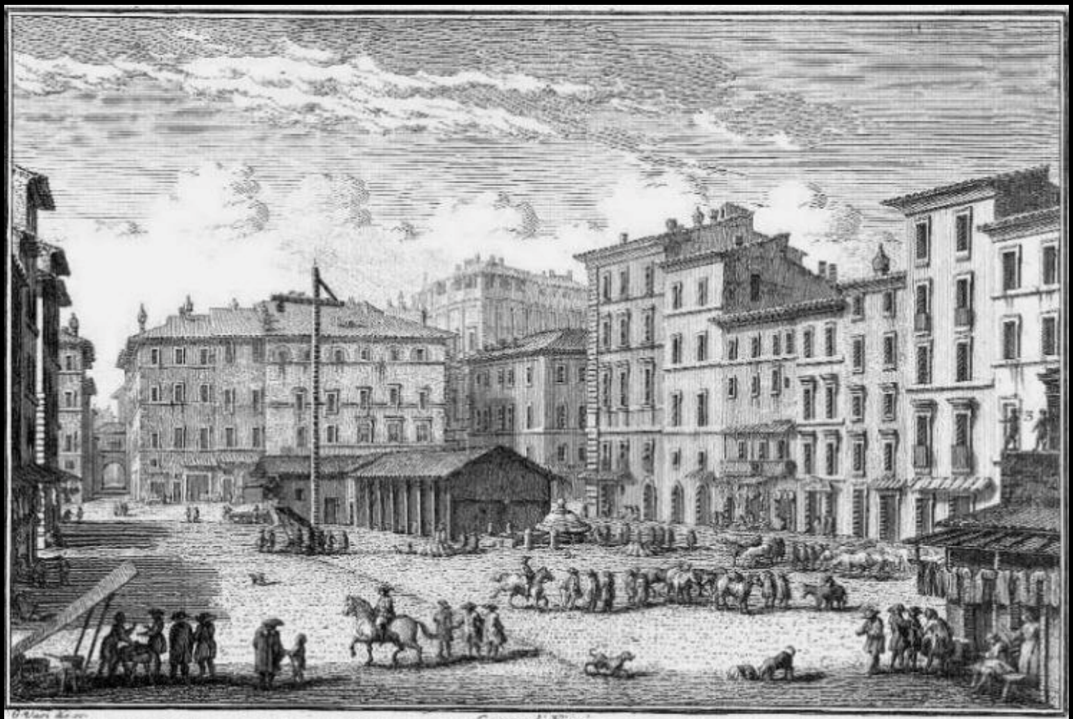
O Visi Less. Campo di Piori s Supplicio de mahrimanti, e trangrefrori delle leggi a Fontana per comodo del merculo di animali deve ancora si vende il grano, e biada y Fianco del Falango Pio- (all