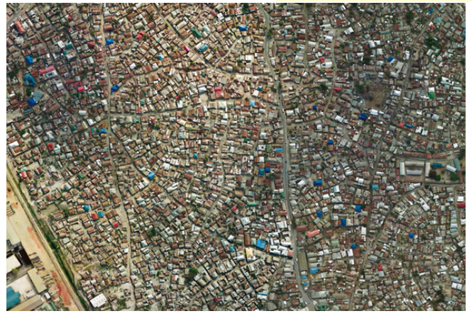
Kielelezo 2 Maeneo yenye msongamano mkubwa ambayo hayajapangwa Dar es Salaam