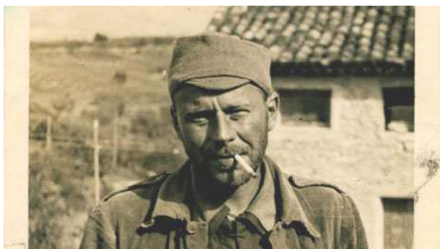
Hollywood contra Franco de Oriol Porta, 2007

Se comprometieron con la libertad y alertaron al mundo de que el futuro de la democracia se jugaba en la Guerra Civil española; fueron los corresponsales extranjeros, los 'idealistas bajo las balas' que describe Paul Preston.