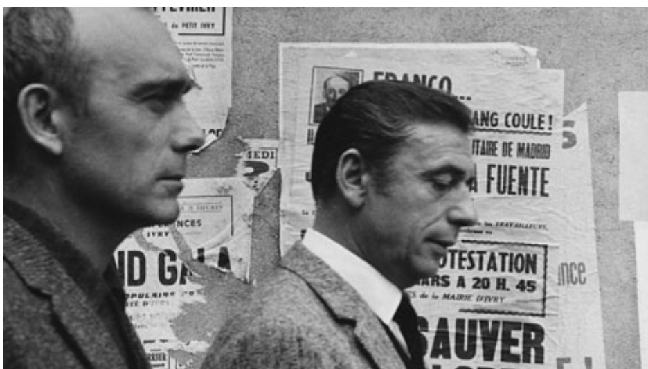
La guerre est finie ( La guerra ha terminado ) de Alain Resnais, 1966