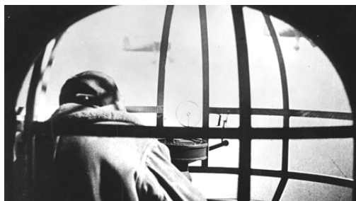
L'Espoir de A. Malraux, 1945

Los escritores estadounidenses Ernest Hemingway, John dos Passos y Dorothy Parker también estuvieron durante esta época en España. En los ocho meses que, entre 1937 y 1938, Hemingway pasó en España, el estadounidense publicó su única pieza teatral, La quinta columna (1938) y además encontró el argumento de una de sus obras más célebres, la novela Por quién doblan las campanas (1940). En este libro, Hemingway narra la historia de un joven norteamericano, miembro de las Brigadas Internacionales, cuya misión es destruir un puente durante un ataque a la ciudad de Segovia.