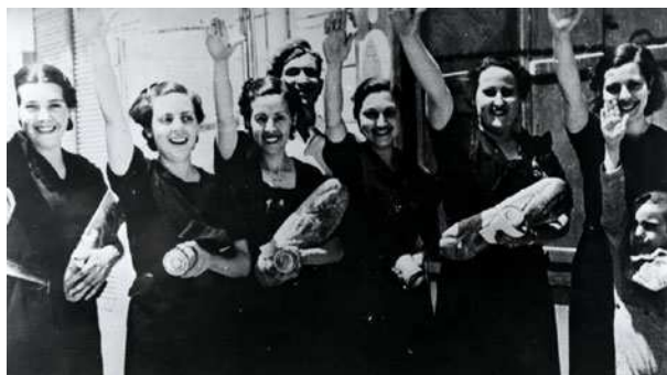
Imagen de un NO-DO. Mujeres haciendo el saludo fascista

En el día de hoy, cautivo y desarmado , el ejército rojo