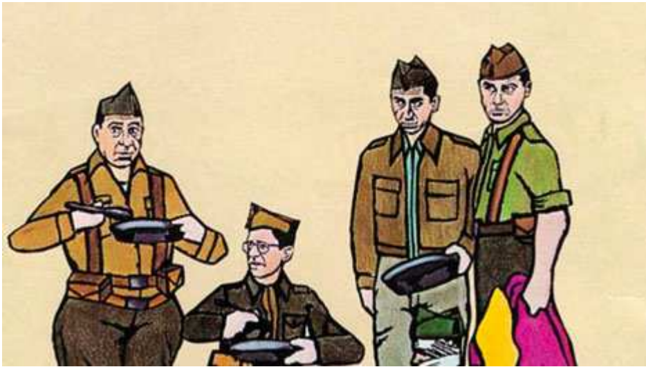
La Vaquilla de Luis García Berlanga, 1985