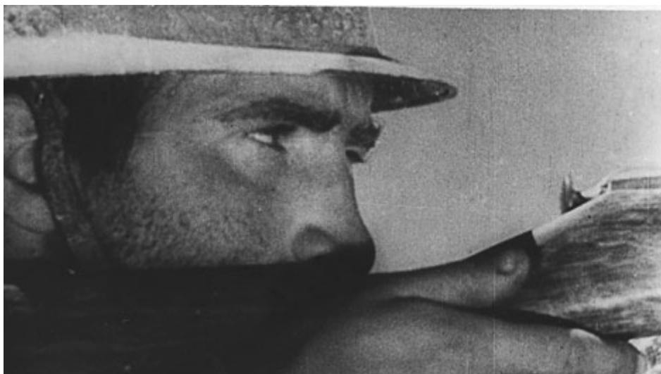
The Spanish Earth (Tierra de España) de Joris Ivens, 1937

Un ciclo de documentales y películas de los últimos setenta años en los que se reflexiona sobre el conflicto y sus consecuencias.