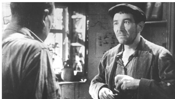
L'Espoir de A. Malraux, 1945

El 1 de abril de 1939 terminó la Guerra Civil española con la victoria de las fuerzas nacionales sobre los últimos grupos republicanos. Francia e Inglaterra habían optado por la no intervención, la Unión Soviética apoyó a los comunistas y debilitó a los anarquistas, y Hitler y Mussolini no ocultaron nunca su apoyo a los fascistas.