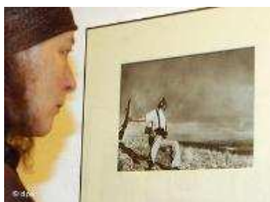
La muerte de un miliciano de Robert Capa

Es verdad que no han quedado estatuas ni monumentos dedicados a los reporteros, pero no es menos cierto que Robert Capa consiguió, al menos, un lugar .....en la memoria de todos nosotros. Es curioso que precisamente una de sus fotografías, que más ha dado la vuelta al mundo, la del miliciano abatido en Cerro Muriano, haya sido la más cuestionada