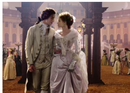
Io, Don Giovanni de Carlos Saura

Y no es ese el único cambio importante en la controvertida orden, duramente criticada durante su elabora-