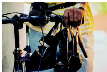
Fotograma del documental Suite Habana

Lugar: CLM.5.02 Clement House, LSE, Houghton Street, WC2A 2AE