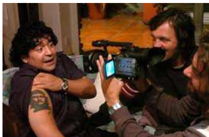
Maradona y Kusturica durante el rodaje del documental

El director serbio Emir Kusturica nos presenta la extraordinaria historia de Diego Maradona: héroe deportivo, héroe popular, ídolo caído e inspiración para millones de personas. El director contó con la colaboración de Maradona para la realización de la película así como acceso a numerosos conocidos del jugador (familiares, amigos de la infancia, Fidel Castro).