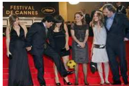
Maradona y Kusturica en el Festival de Cannes, donde se presentó la película en 2008

Lugar: CLM.5.02 Clement House, LSE, Houghton Street, WC2A 2AE