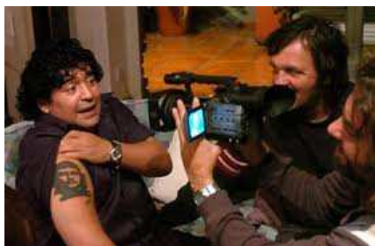
Maradona y Kusturica durante el rodaje del documental

En el documental, Kusturica retrata un Maradona de mil y un rostros sin olvidar cómo el ídolo de las graderías cayó en el infierno de la droga o cómo su fuerte personalidad le ha llevado a enfrentarse contra todo aquel que represente autoridad.