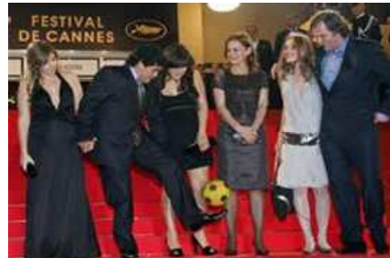
Maradona y Kusturica en el Festival de Cannes, donde se presentó la película en 2008

Lugar: CLM.5.02 Clement House, LSE, Houghton Street, WC2A 2AE