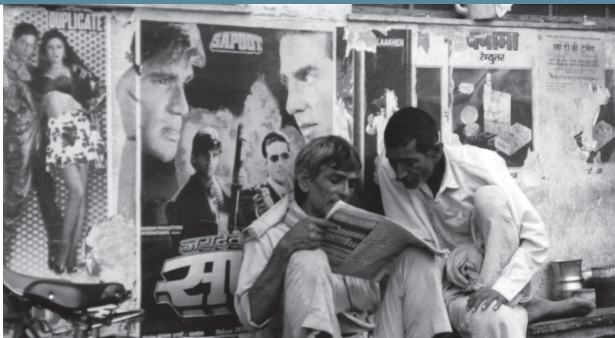
Indiens partageant un journal à Mumbai – Jo Beall