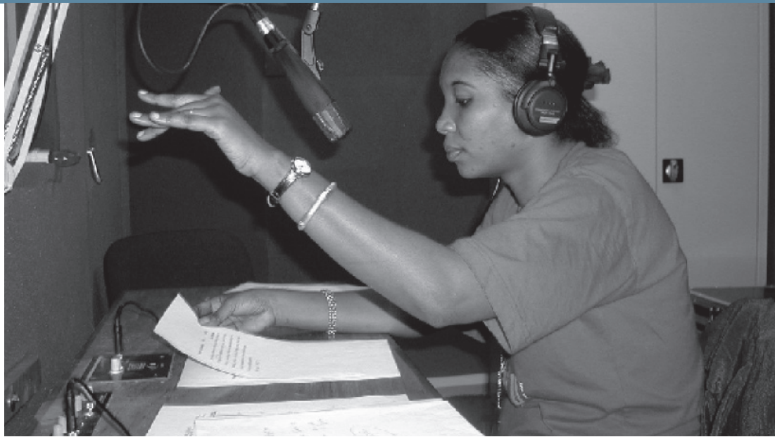
Journaliste à la Radio Okapi – Fondation Hironnelle