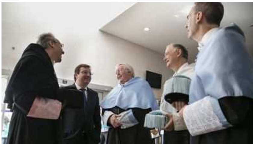
Paul Preston, junto con responsables de la Universidad de Extremadura y el presidente de la Junta

De hecho, su relación con España comenzó a finales de los 60 y "mi primer viaje -ha revelado- fue a esta tierra". "Extremadura supone para mí la Guerra Civil y el sufrimiento del pueblo español", ha afirmado el historiador londinense, quien en sus inicios como historiador decidió aparcarse su interés por la Segunda Guerra Mundial por el de la Guerra Civil española, merced al trabajo del profesor Hugh