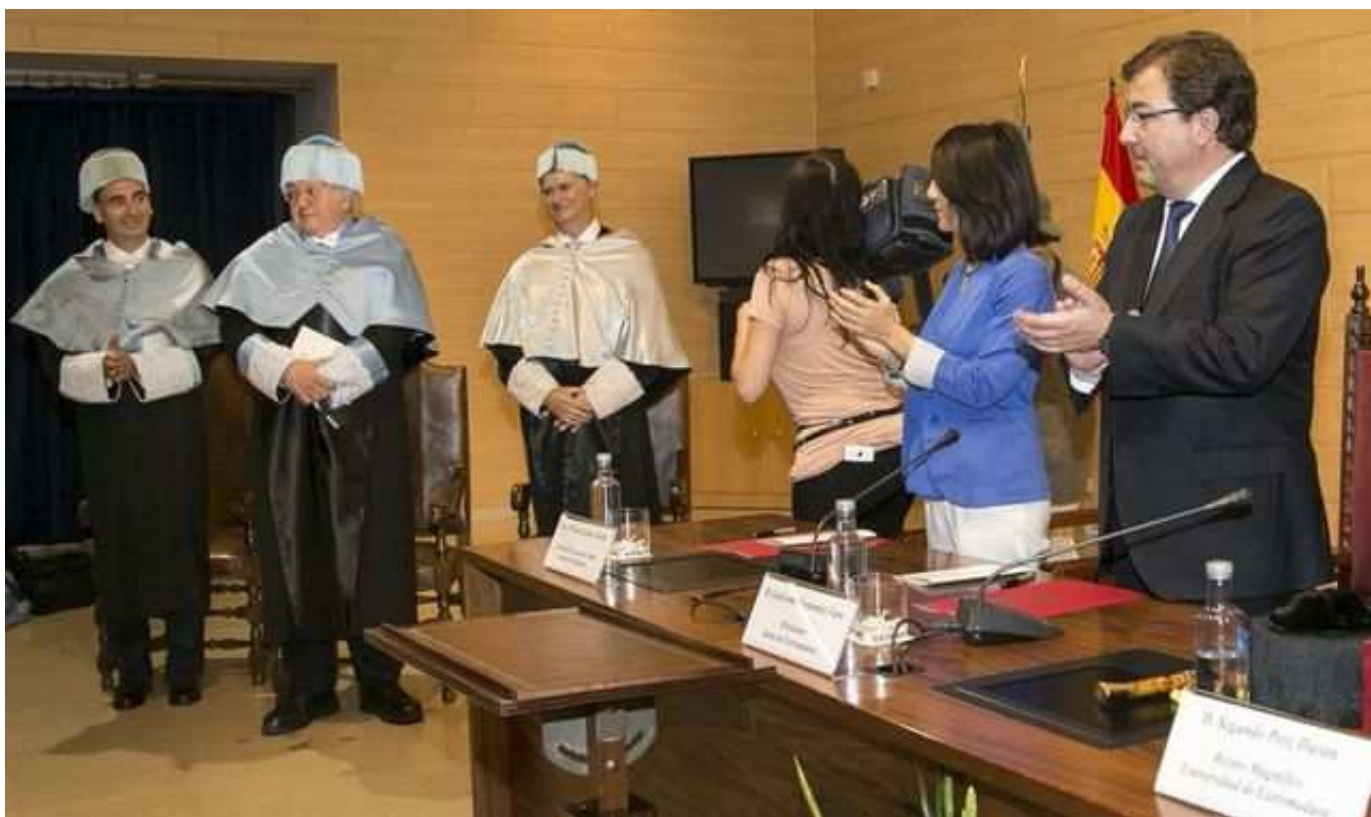
Aplausos para Paul Preston en el acto

Desde un prisma académico, Preston ha asegurado que la UEx goza de una "muy merecida y creciente reputación internacional, por lo que es un privilegio el poder considerarse una pequeña parte de ella".