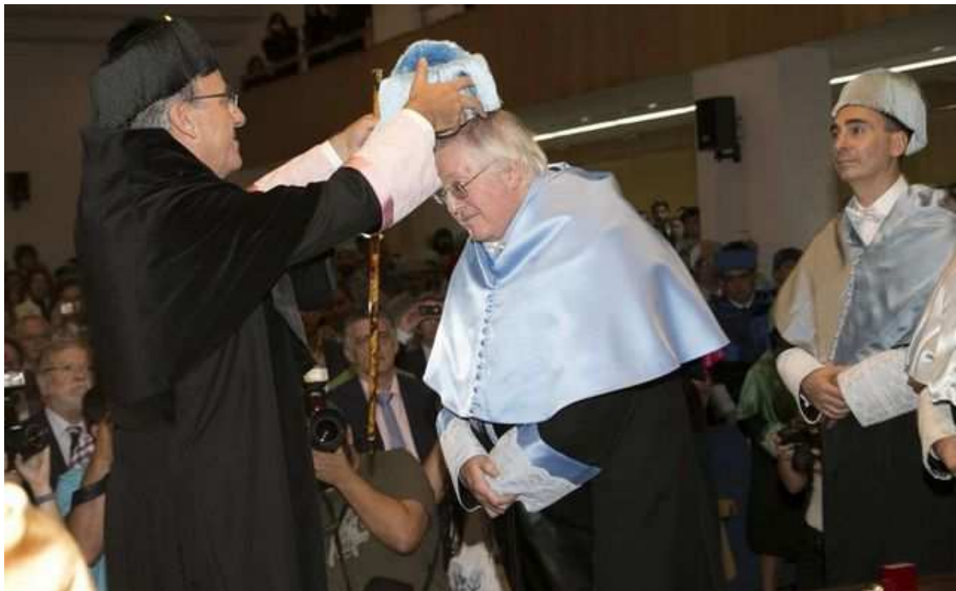
Momento del acto de investidura como Doctor Honoris Causa al historiador e hispanista

El historiador e hispanista británico Paul Preston , investido doctor honoris causa por la Universidad de Extremadura , ha afirmado que Francisco Franco tenía "aspectos bastantes cómicos", como el hecho de que creía que "Pablo VI era un bolchevique".