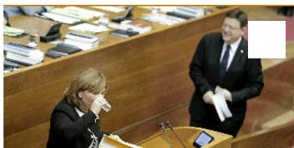
Sesión de control a Puig en las Corts (29/10/15)