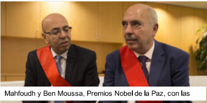
Mahfoudh y Ben Moussa, Premios Nobel de la Paz, con las

Abdussattar ben Moussa: 'La emigración es un problema de derecho y de razón; todavía hay demasiadas restricciones'