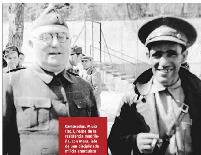
Camaradas. Miaja (izq.), héroe de la resistencia madrileña, con Mera, jefe de una disciplinada milicia anarquista