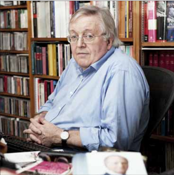
PAUL PRESTON (Liverpool, 1946) también es biógrafo de Franco.

“Utilizó los poderes heredados de Franco, que eran muchos, para controlar a las Fuerzas Armadas, que, recordemos, en esa época estaban entrenadas no para defender al país de la amenaza exterior, sino que contra sus supuestos enemigos interiores. Mientras, sus consejeros constitucionales buscaron la manera de esquivar los límites, las trabas, que le había puesto Franco para abrir la puerta al proceso democrático, sin aparecer traicionándolo”.