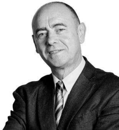
El retorno de los hispanistas

Por lo general, se habían entusiasmado con la España de la Guerra Civil desde la etapa de formación universitaria. Vienen a preparar sus tesis, a ver y escuchar testimonios de la gente que atravesó aquellos trances. Fruto de esos periplos viajeros aparecen en las librerías textos sobre la República, la guerra y el franquismo.