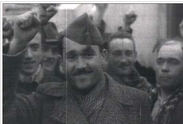
El agente de la NKVD destinado en España, Alexander Orlov.

Su libro se adentra en las purgas estalinistas en la Guerra Civil Española. ¿Cree que la propaganda lanzada por el NKVD en España y los asesinatos selectivos contra el POUM y la CNT fue un factor clave en la pérdida de la República?