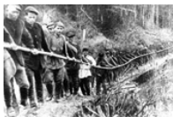
El navío Dzhurma y las 12.000 muertes del Artículo

El NKVD también era responsable de la seguridad de los líderes del PCE. Desde diciembre de 1936, una de las tareas del NKVD era localizar a los enviados de Trotski, a sus exsecretarios y secretarios actuales o a abiertos simpatizantes. Luego Moscú decidiría qué hacer con ellos. En varios casos, la gente simplemente desaparecía sin dejar rastro.