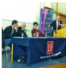
Conferencia sobre 'El Terror de Franco' en la London School of Economics, Londres.