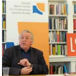
El historiador Paul Preston, durante la presentación de su libro El Zorro Rojo en Londres.

Las acusaciones por la matanza de Paracuellos, durante la Guerra Civil, lo tacharon de monstruo represor. Más tarde, su papel durante la transición le sirvió para ganarse la fama de luchador altruista por el consenso democrático. Lejos de estos puntos de vista, la realidad sobre Santiago Carrillo podría diferir sustancialmente del blanco y negro y entrar en una escala de grises que explicarían la astucia de un oportunista que supo sobrevivir a los envites y mantener el poder en el partido durante cuatro décadas de dictadura. Al menos esta es la visión que plantea Paul Preston, el historiador hispanista que, tras años de trabajo de investigación, ha querido levantar polvo y demoler el mito del que fuera Secretario General del PCE durante veinte años. El jarro de agua fría llega apenas un año después de su muerte, el pasado 18 de septiembre.