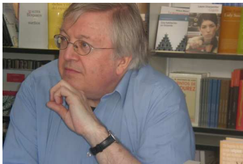
Paul Preston en la Feria del libro de Madrid (R. M. H.)

Durante la Guerra Civil española alrededor de 200.000 hombres y mujeres fueron ejecutados lejos del frente de manera extrajudicial o tras precarios procesos legales. Al menos 300.000 perdieron la vida en los frentes de batalla. Un número desconocido de hombres, mujeres y niños fueron víctimas de los bombardeos y los éxodos que siguieron a la ocupación del territorio por parte de las fuerzas militares de Franco. Tras la victoria definitiva del bando franquista a finales de 1939, en la totalidad de España alrededor de 20.000 republicanos fueron ejecutados, otros tantos -no se ha podido lograr saber cuántos exactamente- murieron de hambre y enfermedades en las prisiones y en los campos de concentración. A más de medio millón de personas no les quedó más remedio que el exilio , convirtiéndose así en refugiados políticos, muchos de los cuales darían por terminada su vida en los campos de internamiento franceses . Varios miles acabarían por pisar los campos de exterminio nazi.