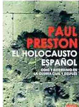
Un libro excelente con un título desafortunado

La masacre sufrida por el pueblo español permite muchas comparaciones con la época nazi pre-holocausto cuando los alemanes fusilaron y torturaron de forma masiva a judíos y otras minorías étnicas, a disidentes políticos y religiosos y a las poblaciones eslavas de los territorios ocupados. La «solución final de la cuestión judía» (título oficial del programa nazi) a partir del año 1941, sin embargo, introduce una dimensión fundamentalmente distinta y desconocida hasta entonces a la historia moderna de occidente. A partir de ahí, ni consideraciones prácticas, ni de estrategia militar ni de beneficio económico podían salvar a los judíos, ni a los