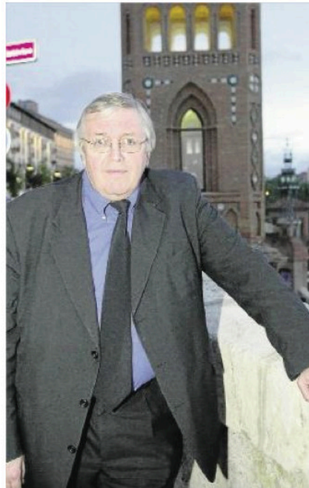
L'historiador Paul Preston.