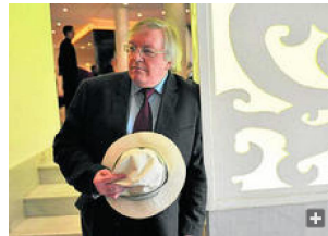
Paul Preston, ayer, en la entrada del hotel Colón.

Hoy no sólo se cumplen 80 años de la proclamación de la Segunda República. "La idea del golpe del 36 empieza el mismo 14 de abril de 1931, en la reunión que la tarde de ese día celebran un grupo de conspiradores". Lo dijo ayer Paul Preston en el hotel Colón a los periodistas para hablar de su libro El holocausto español (Debate).