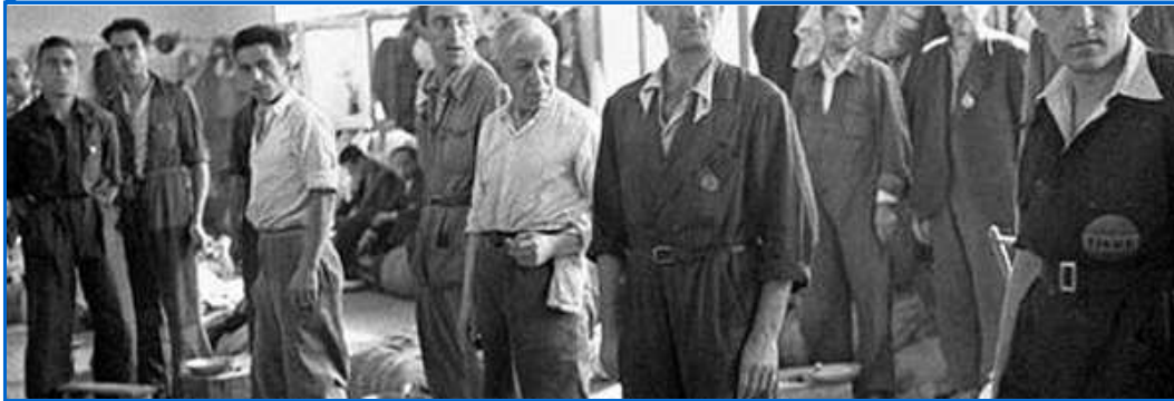
Prisioneros republicanos en la Guerra Civil.

El ensayo de Preston nos lleva de nuevo a esa época negra de la historia de nuestro país y no oculta nada. Para el autor, hay que establecer claras diferencias entre ambos bandos , entre “las dos represiones”, la republicana y la franquista, porque “fueron muy diferentes, tanto cuantitativamente como cualitativamente” a pesar de que ambas, dice Preston “provocaron la muerte de decenas de miles de personas”.