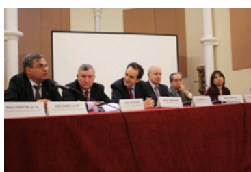
Intervención en el acto del alcalde de Burriana.