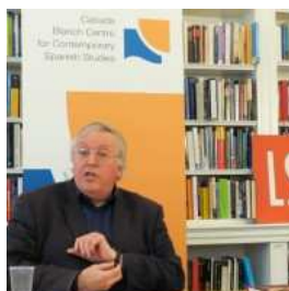
El historiador Paul Preston, durante la presentación de su libro El Zorro Rojo en Londres.

Las acusaciones por la matanza de Paracuellos, durante la Guerra Civil, lo tacharon de monstruo represor. Más tarde, su papel durante la transición le sirvió para ganarse la fama de luchador altruista por el consenso democrático. Lejos de estos puntos de vista, la realidad sobre Santiago Carrillo podría diferir sustancialmente del blanco y negro y entrar en una escala de grises que explicarían la astucia de un oportunista que supo sobrevivir a los envites y mantener el poder en el partido durante cuatro décadas de dictadura. Al menos esta es la visión que plantea Paul Preston, el historiador hispanista que, tras años de trabajo de investigación, ha querido levantar polvo y demoler el mito del que fuera Secretario General del PCE durante veinte años. El jarro de agua fría llega apenas un año después de su muerte, el pasado 18 de septiembre.