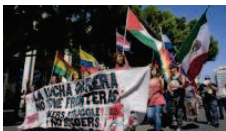
Estados Unidos, el segundo país con el mayor número de hispanohablantes EFE - Nueva York