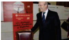
Wert destaca el "activo" económico y "vertebrador" del español en el mundo EFE - Fuensaldaña (Valladolid)