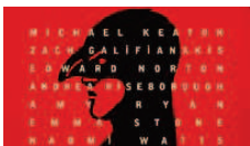
'Birdman' arrasa en las nominaciones a los Globos de Oro eldiarioes cultura