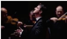
El "querubín" Jaroussky vuelve a electrizar al Real, esta vez con Vivaldi EFE - Madrid