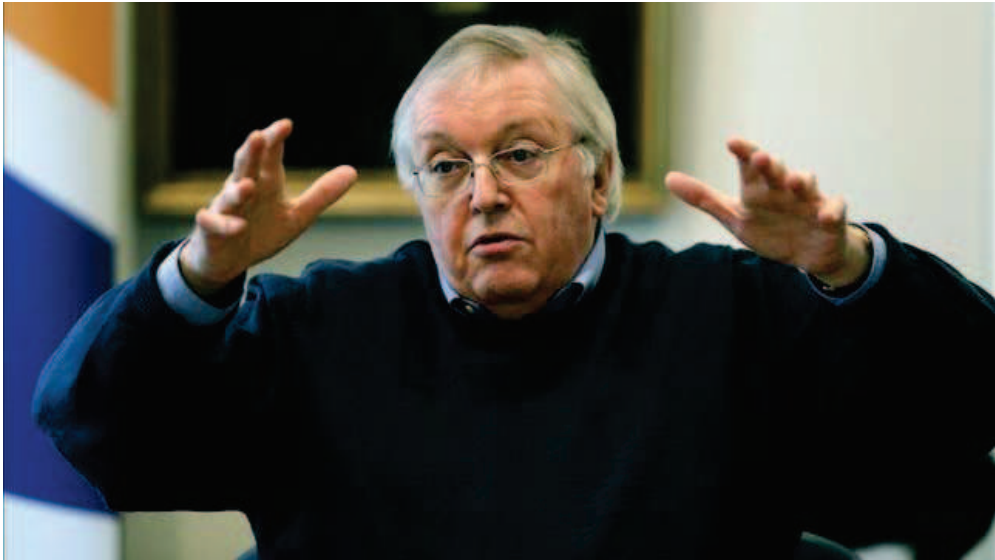
El historiador Paul Preston aborda las traiciones en el bando republicano al final de la guerra

El historiador británico Paul Preston analiza en su último libro, "El final de la guerra. La última puñalada a la República", las traiciones y deslealtades que se vivieron dentro del bando republicano al final de la Guerra Civil.