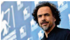
Iñárritu entre los favoritos para las nominaciones de los Globos de Oro EFE - Los Ángeles (EE.UU.)