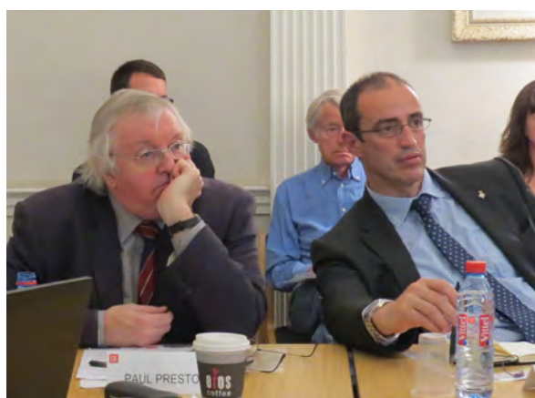
Durante este curso recibimos en dos ocasiones la visita de Antoni Vives, teniente de alcalde del Ajuntament de Barcelona.