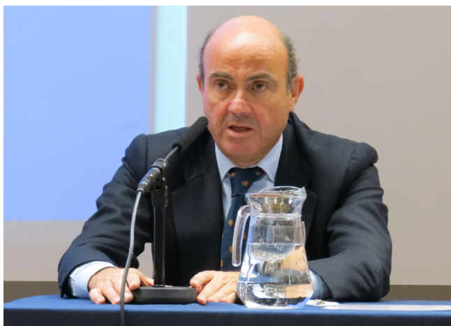
El Ministro español de Economía, Luis de Guindos, pronunció una conferencia sobre estrategias económicas el 4 de octubre de 2012, a la que todos los miembros del Centro fuimos invitados.