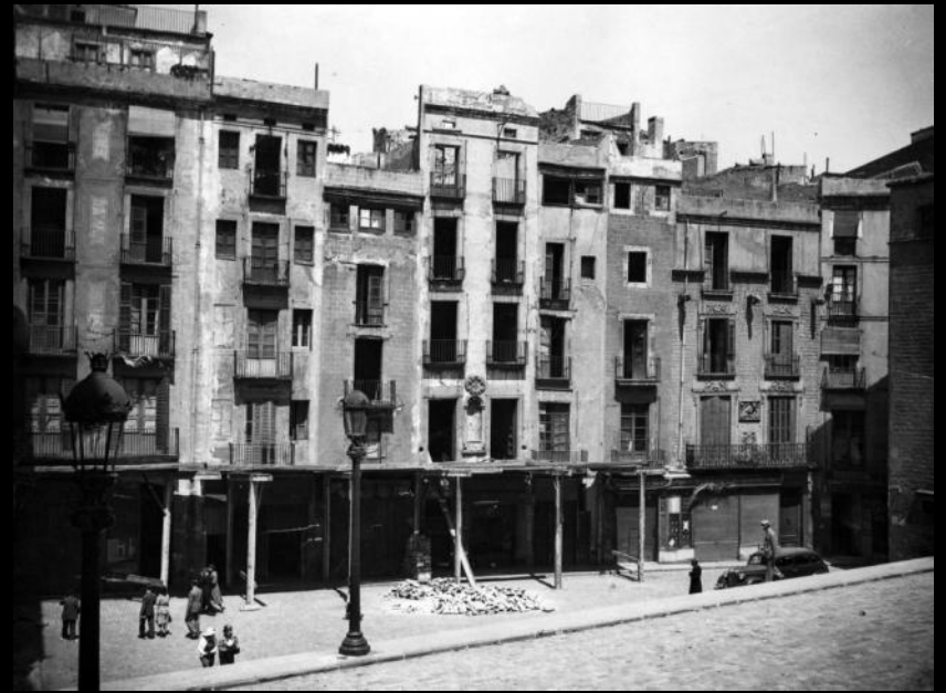
...immediately after the war...