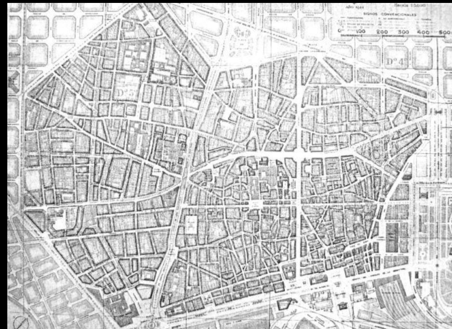
Vilaseca's 1930 inner city reform plan.