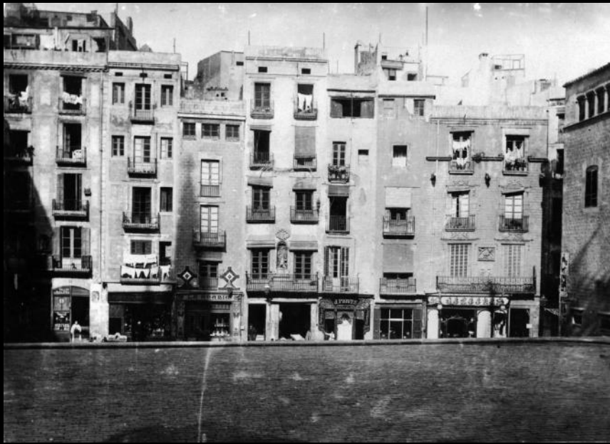
View of Corribia street before the war...