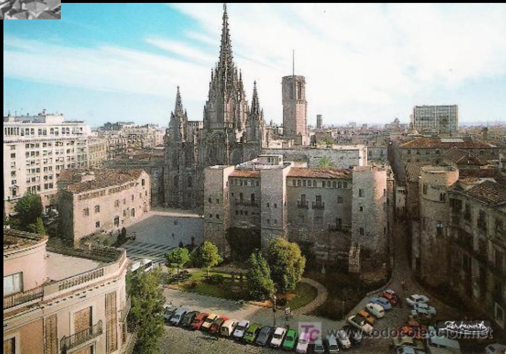
View of Avinguda de la Catedral and Plaça Nova, 1960s (?).