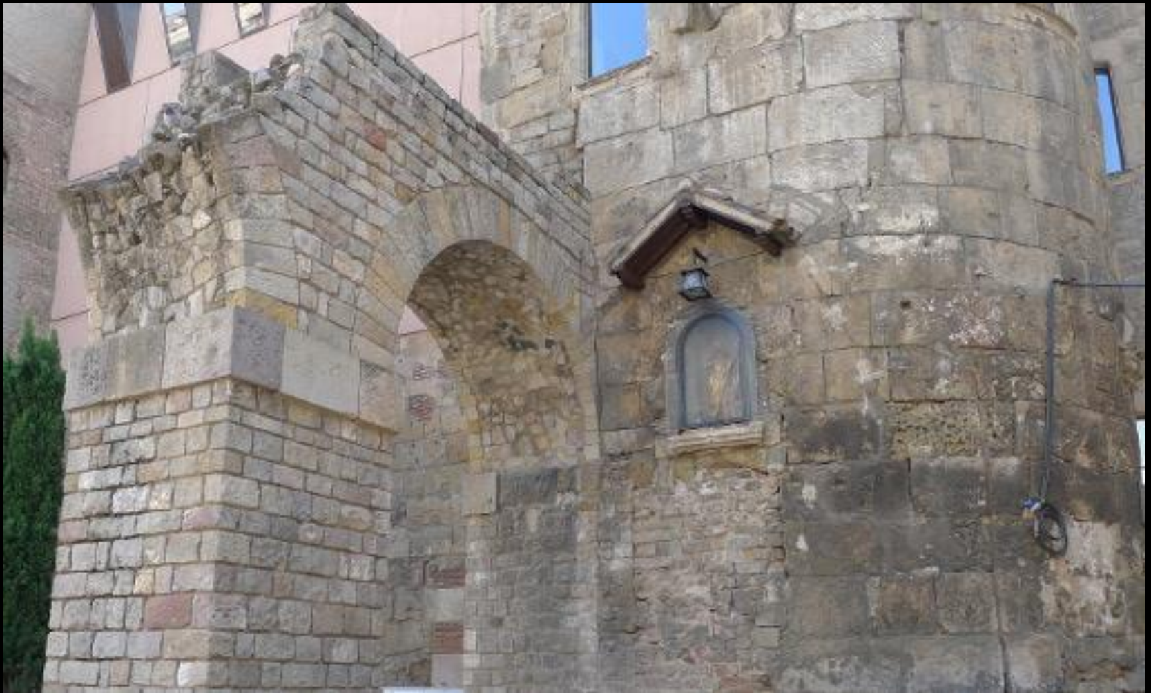
The little vaulted niche with Sant Roc in the left Roman tower on Plaça Nova.