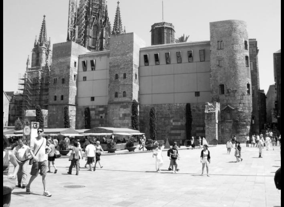
The cleared façade of the House of the Archdeacon today.