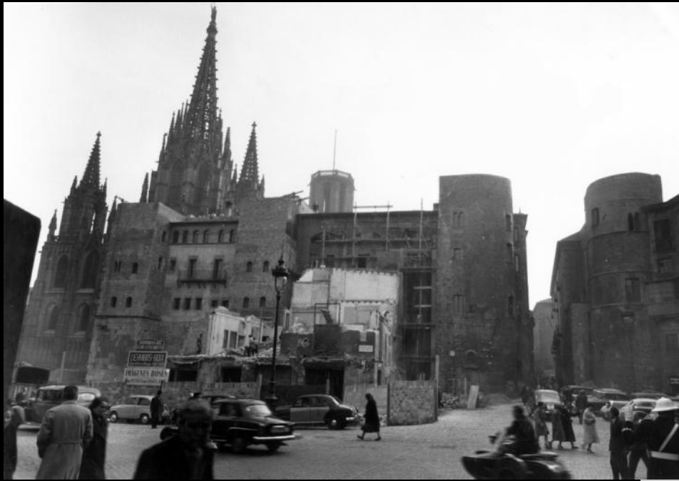
Last remains of old houses attached to the House of the Archdeacon on disappearing Corribia street.