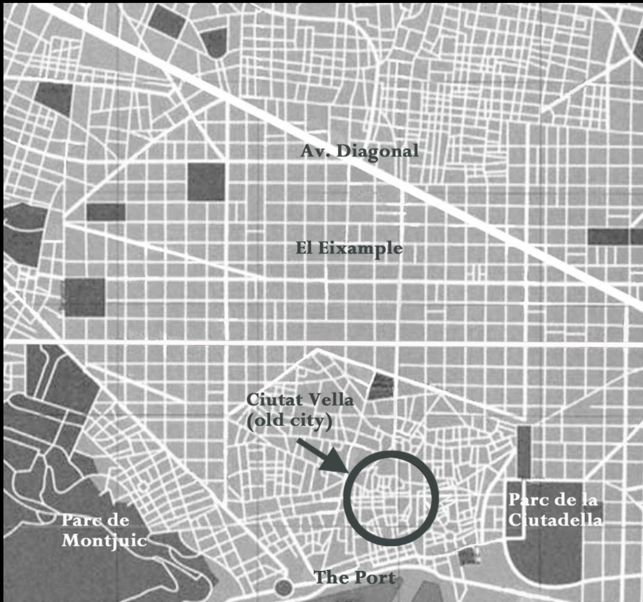
Map of contemporary Barcelona. Circle shows the old city in the environs of the Cathedral.