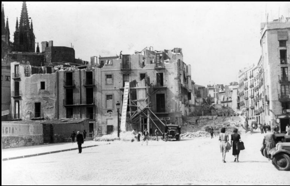
Demolition works and clearing of debris.