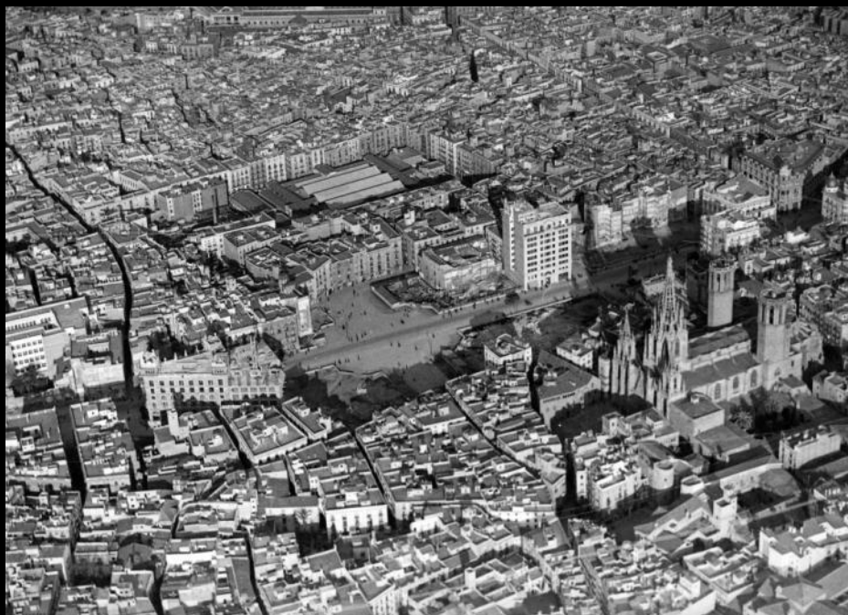
Bird's eye view of old Barcelona, 1925.