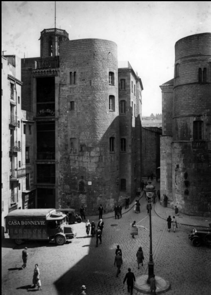
Plaça Nova before the war (1933).