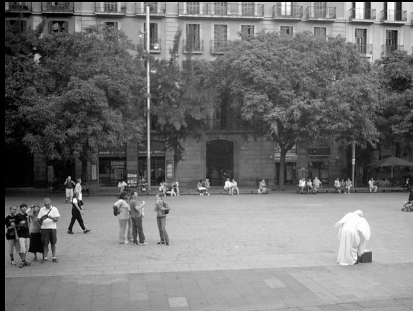
...same view today.