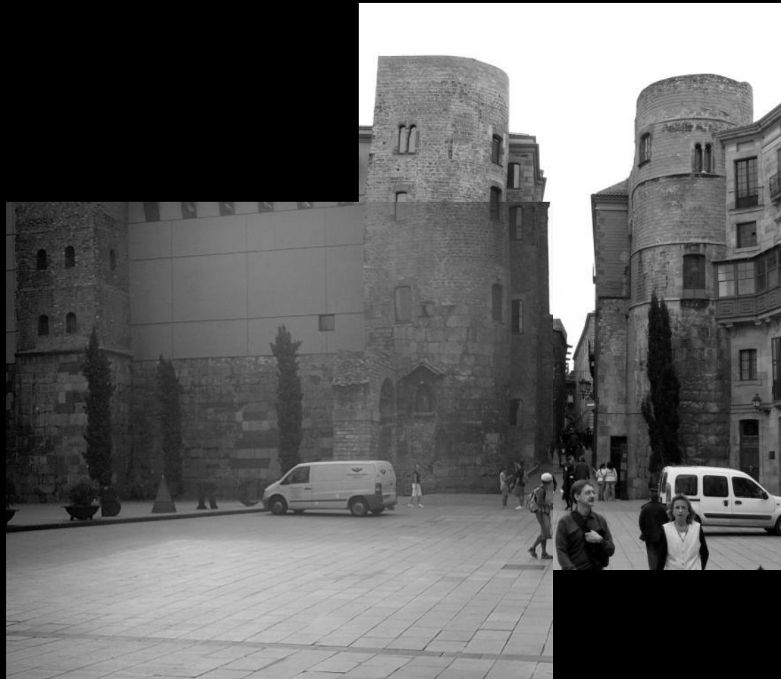
Plaça Nova today with the towers and the House of the Archdeacon.