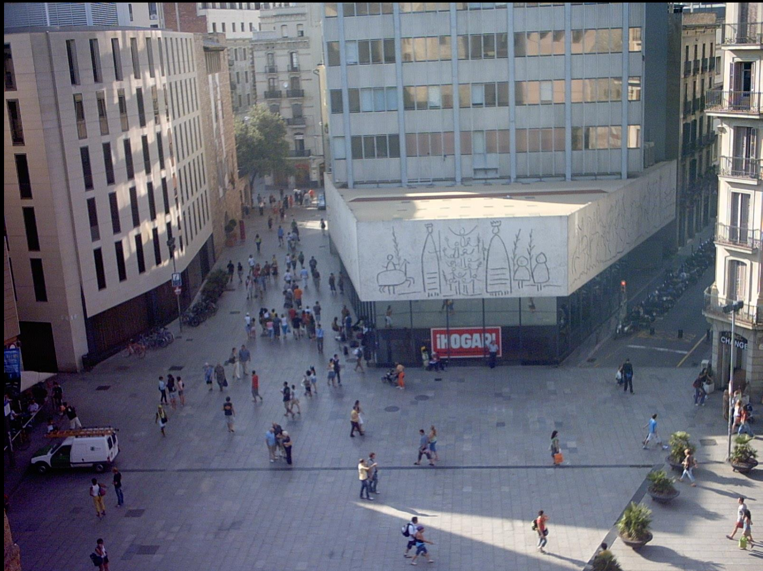
Plaça Nova seen from the House of the Archdeacon with the Col·legi d'Arquitectes de Catalunya (1958) by Joaquim Busquets with friezes by Carl Nesjar.