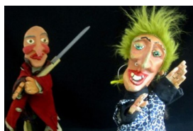
Teatros catalanes piden la "libertad inmediata y sin cargos" de los titiriteros