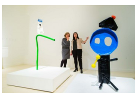
Una exposición explora la presencia del objeto en la obra de Miró