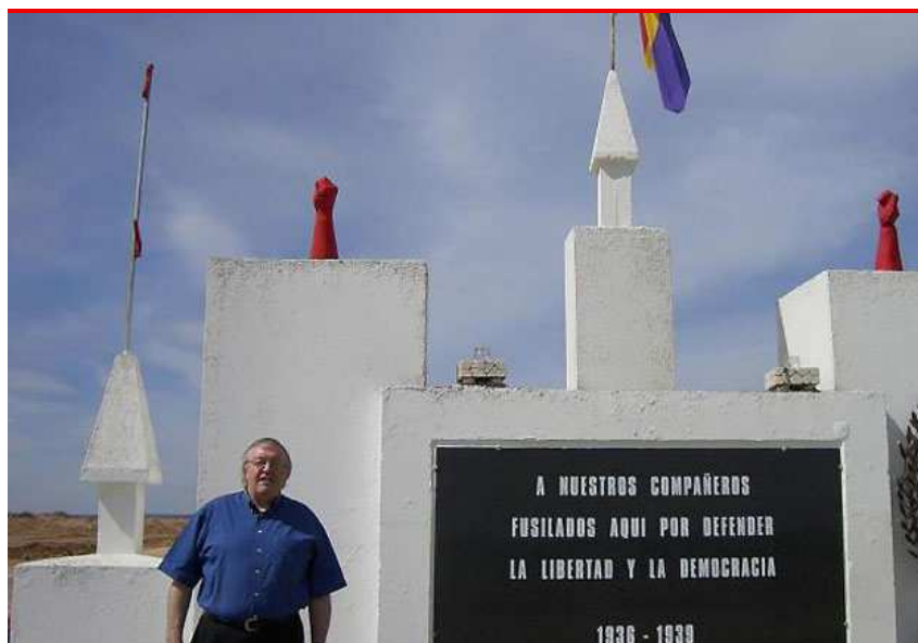
En Pozos de Caudé en mayo de 2006.

Yo creo que tú lo crees. Pero no es el caso. Se trata de una palabra que en sus orígenes quiere decir sacrificio quemado, pero al llegar al siglo XIV se utiliza en todos los idiomas europeos para significar una gran masacre. Aplicarlo a lo que les sucedió a los judíos empezó hacia los años 50, no durante. Después ha habido una polémica masiva con cientos de libros y miles de artículos sobre si es lícito el monopolio de esa palabra. La gran mayoría de intelectuales judíos creen que es mejor no usar holocausto por sus orígenes y prefieren la hebrea 'shoah', que significa calamidad o catástrofe. Y ahora vuelvo a las críticas: he recibido dos, en privado, de dos locos. El primero me llamó neonazi por utilizar esa palabra en el título y el segundo me acusó de poner en cuestión la legitimidad del estado de Israel. Los dos sin leer el libro. Otros me critican diciendo que no se pueden comparar las dos cosas. Pero no lo hago. Escogí una palabra que expresase mi indignación por lo que ocurrió.