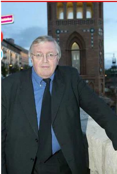
Paul Preston (2011)

Paul Preston (Liverpool, 1946) no es un hombre simpático. Posiblemente, tampoco le hace falta. En su currículum figuran los títulos de doctor en Historia por la Universidad de Oxford, catedrático de Historia Contemporánea Española y director del Centro Cañada Blanch para el Estudio de la España Contemporánea en la London School of Economics británica. Entre los premios que ha recibido, brilla especialmente el Príncipe de Asturias de Historia Contemporánea , compartiendo espacio con la Gran Cruz de la Orden de Isabel la Católica y la Encomienda de la Orden del Mérito Civil. Con Hugh Thomas e Ian Gibson, forma la consabida triada de hispanistas británicos que tanto incomodan a ciertos sectores poco partidarios de revisar nuestra Historia más reciente. Con todo ello en mi conciencia y sorteando los canales habituales de prensa, me atrevo a abordarlo en un acto promocional. Está firmando ‘El holocausto