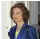
POLÍTICA Sofía de Grecia