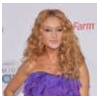
CELEBRITIES Paulina Rubio