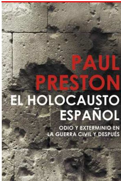
El 'Holocausto Español', el libro que está promocionando Paul Preston

El exterminio en España era menos científico. Se podría hacer un paralelismo con cómo estaba de desarrollada la industria española y la alemana. Había gente cruel y enloquecida como Queipo de Llano, que era un monstruo, o el jefe de los servicios psiquiátricos del ejército de Franco, el coronel Antonio Vallejo-Nágera, que organizó experimentos con las presas para ver cómo extirpar el gen rojo. No con cirugía, sino apartando los bebés de las madres y haciendo cosas así. Ese coronel se alimentaba de las teorías eugenésicas alemanas.