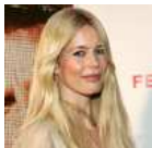
MODA Claudia Schiffer