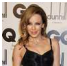
CELEBRITIES Kylie Minogue