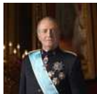
POLÍTICA Juan Carlos I de Borbón