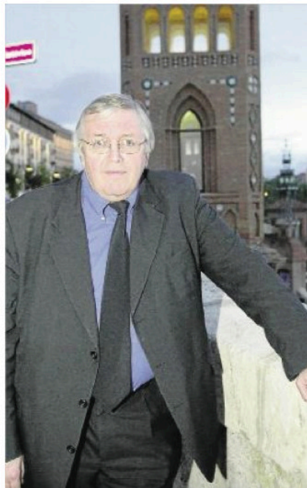
L'historiador Paul Preston.