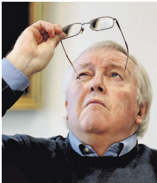
Preston acaba de publicar su nueva obra.

—El caso más flagrante es la Guerra Civil, seguida por una dictadura totalmente incompetente económicamente, que significó que a finales de los años 50 España tuviera un nivel de vida muy por debajo que en los años 20. Una sociedad incapaz de resolver sus problemas mediante la negociación y el debate pierde muchísi-