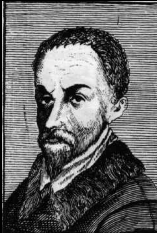
CÆSAR CREMONINUS Philosophus Patavinus.