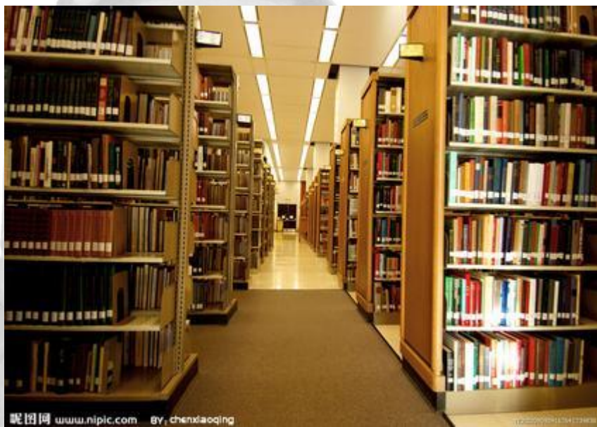
Tú shū guǎn 图书馆 library

馆 [guǎn] a place for cultural or sports activities