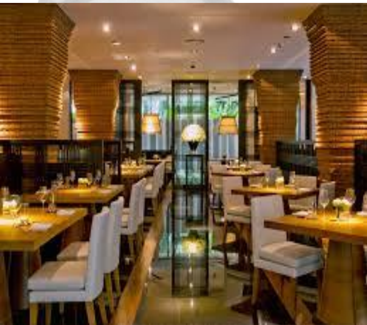
Fàn diàn 饭店 restaurant