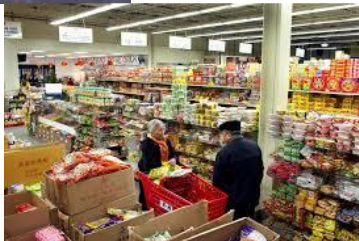
Chāo shì 超市 supermarket