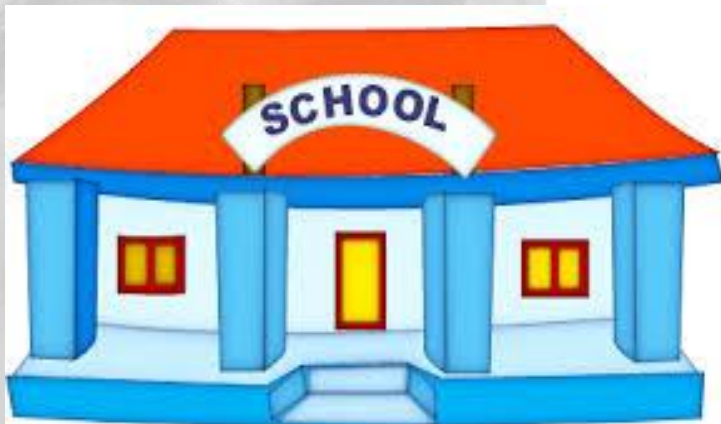
Xué xiào 学校