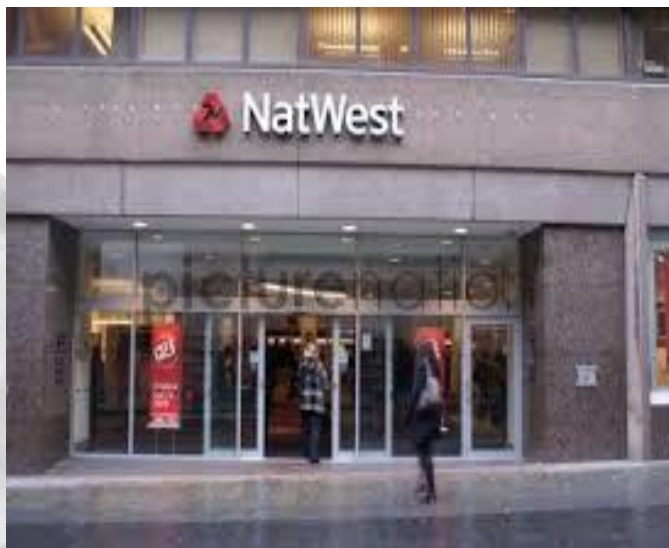
Yín háng 银行 bank