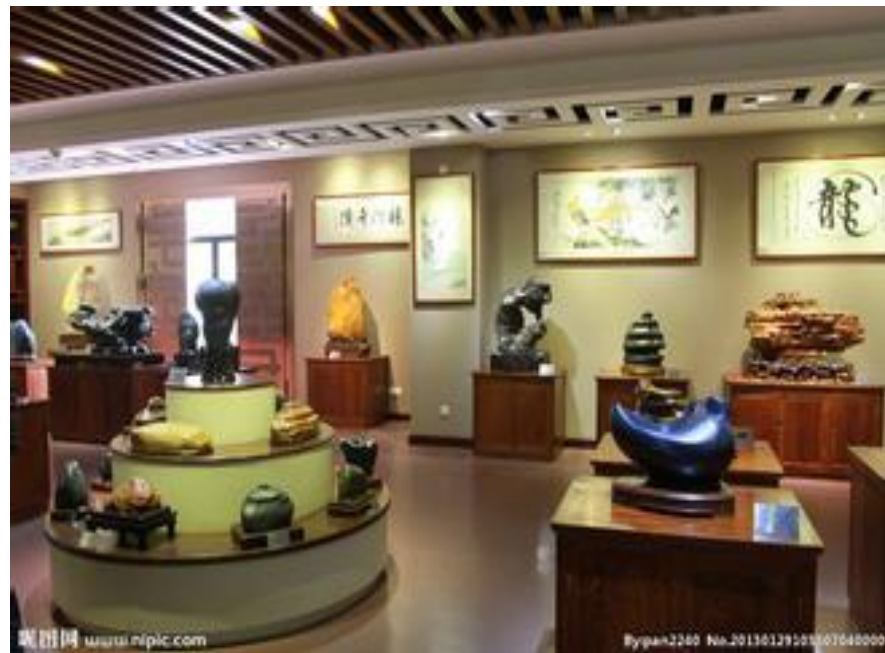
Bó wù guǎn 博物馆 museum