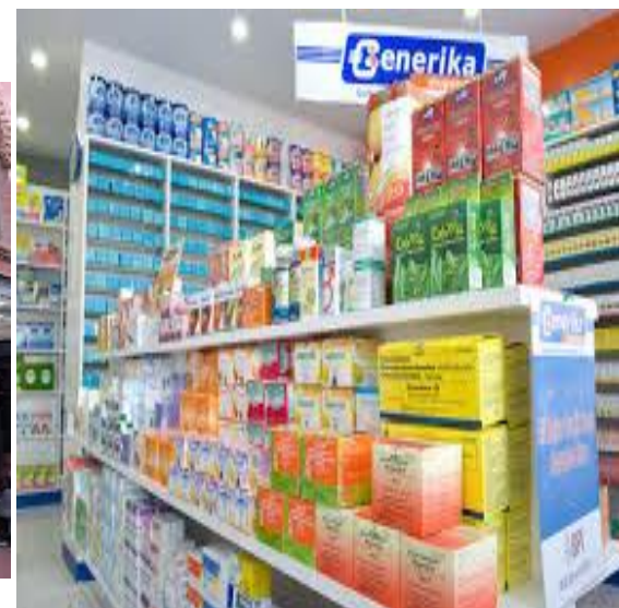
Yào diàn 药店 drugstore