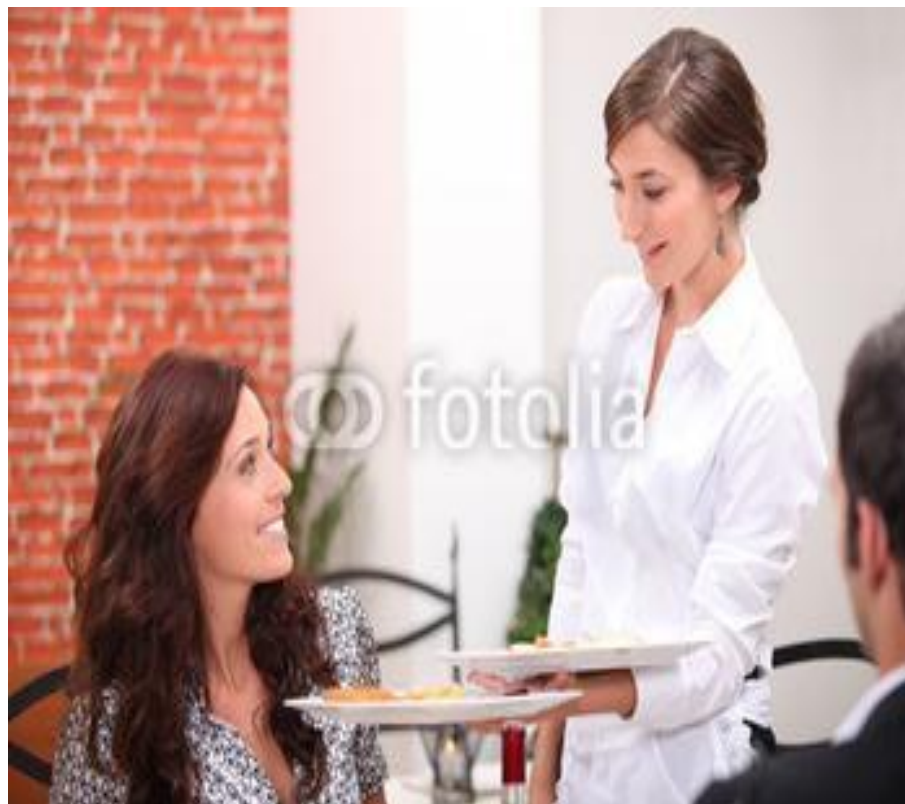
Fú wù yuán 服 务 员