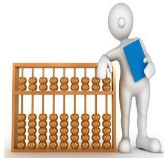
Kuài jì 会计 accountant