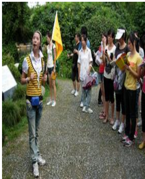
Dǎo yóu 导游 Tour guide