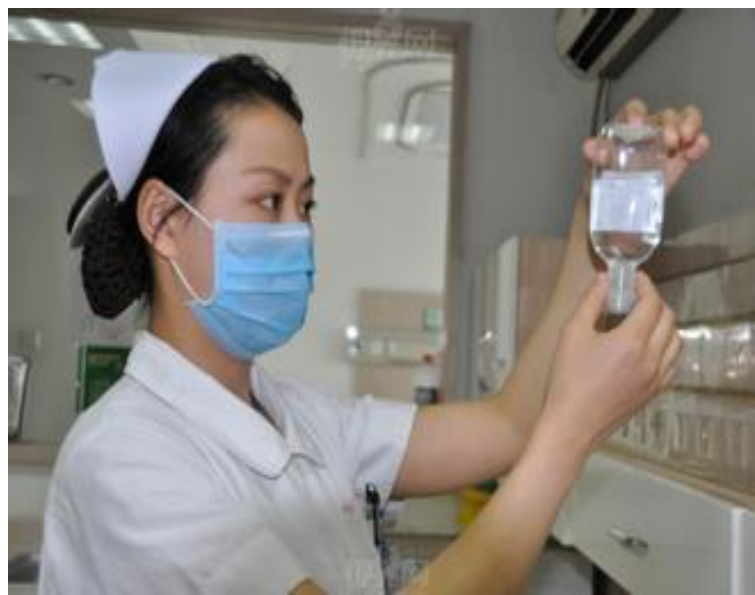
Hù shì 护士 nurse