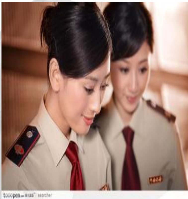
Gōng wù yuán 公 务 员