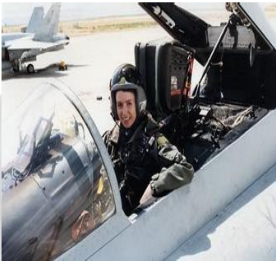
Fēi xíng yuán 飞行员