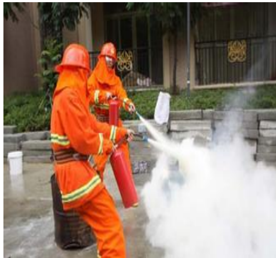
Xiāo fáng yuán 消防员