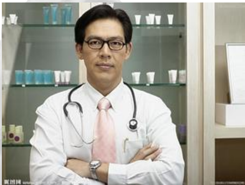
Yī shēng 医生 doctor