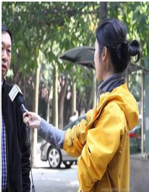
Jì zhě 记者 journalist