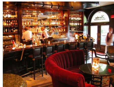
旁边 pángbian side